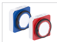
Fácil de mantener