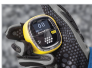
Fácil de manejar