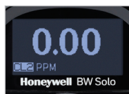
Fácil de leer