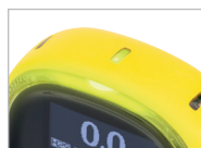
Fácil de ver